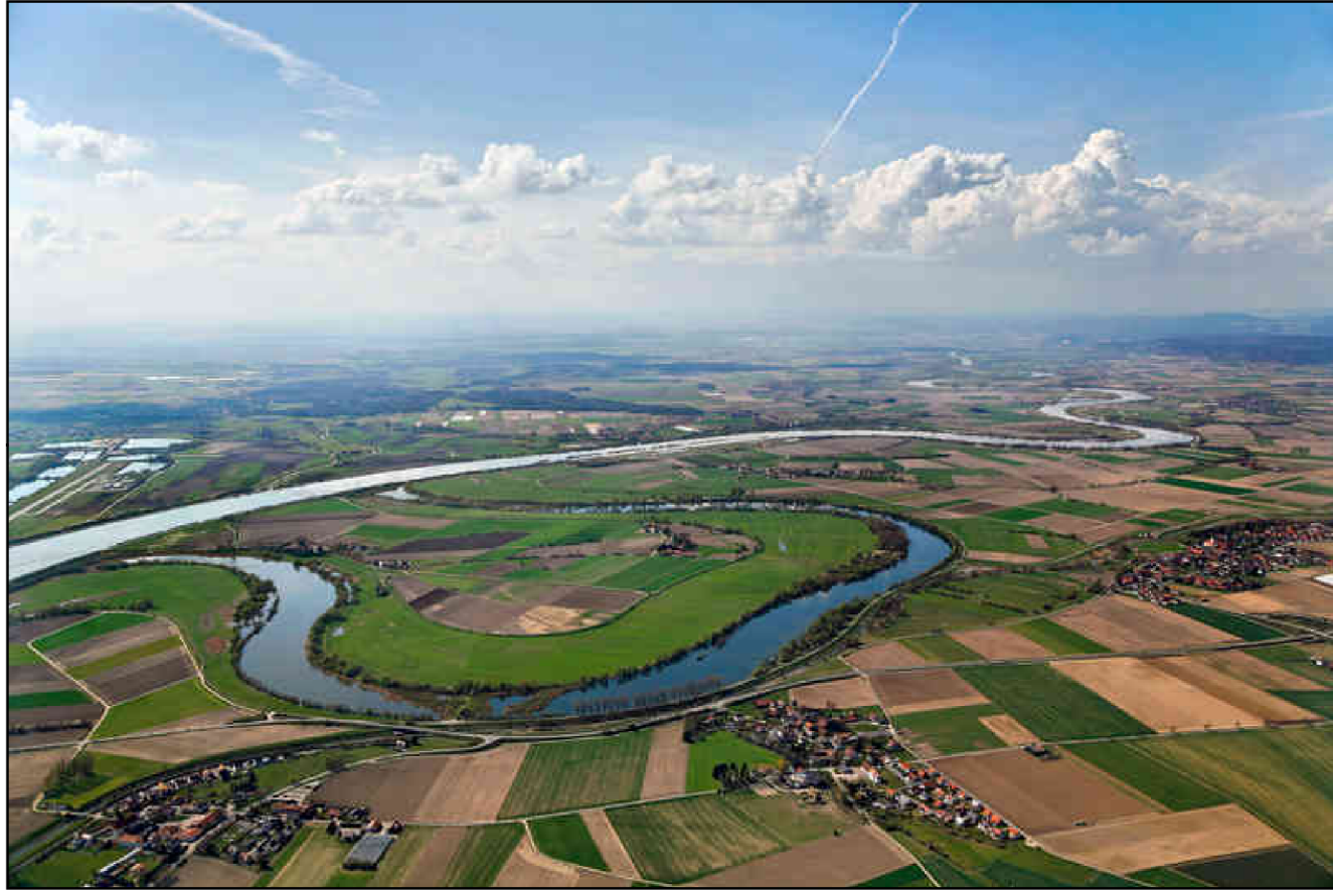
Blickrichtung West: Oberauer Donauschleife