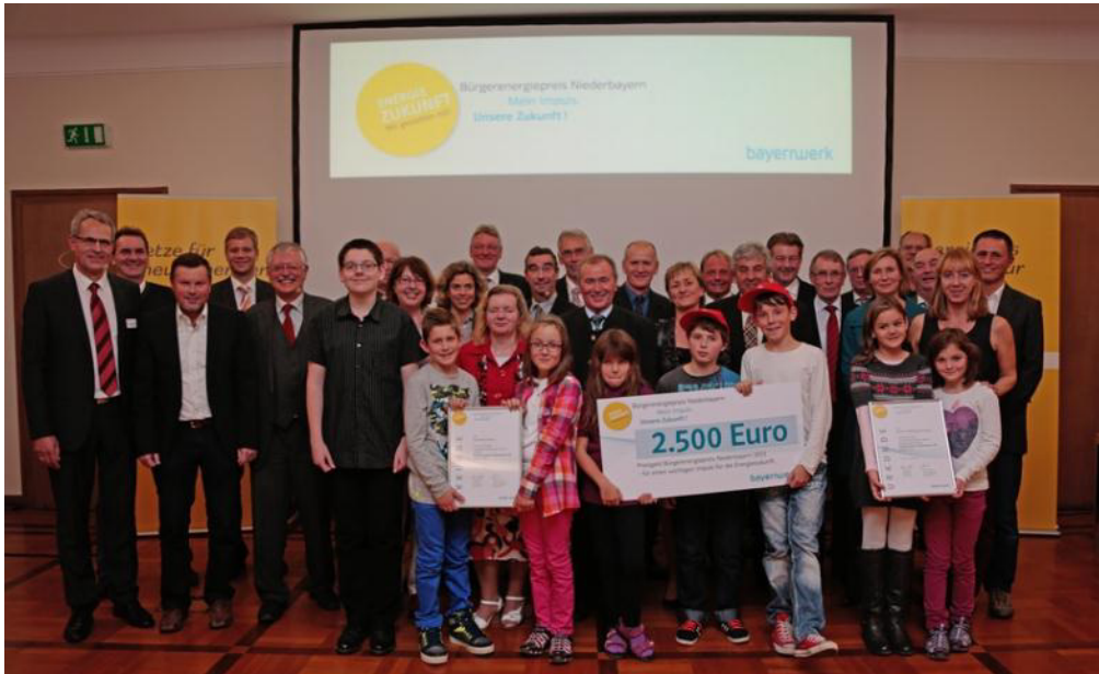
Die Preisträger bei der Verleihung